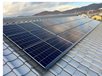
(下之郷自治会 M様邸)